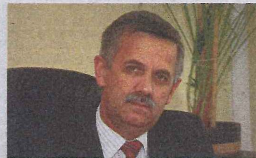
JÓZEF JODŁOWSKI – STAROSTA RZESZOWSKI

Powiat Rzeszowski jako jedyny w Polsce, posiadając własne tereny zdecydował się na wykonanie pełnego uzbrojenia terenu realizując projekt w ramach Programu Operacyjnego Rozwój Polski Wschodniej. Jego realizacja przyczyni się do rozwoju przedsiębiorczości na terenie województwa Podkarpackiego, jak również pozyskania inwestorów czego efektem będzie powstanie około tysiąca nowych miejsc pracy. Warto zaznaczyć, że obszar Parku przylega do linii kolejowej E30 Rzeszów-Kraków i docelowo będzie skomunikowany z drogą międzynarodową E40, S9 drogą krajową prowadzącą z Radomia do granicy ze Słowacją i S19 planowaną drogą ekspresową we wschodniej części kraju pomiędzy przejściem granicznym z Białorusią a granicą ze Słowacją dając mu znakomite położenie wobec najważniejszych szlaków komunikacyjnych.