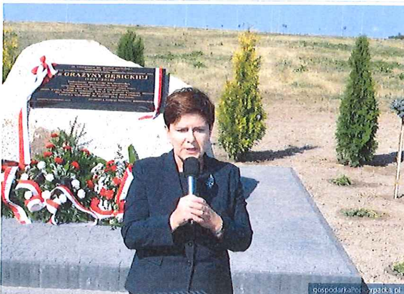
Beata Szydło.

RZESZÓW. Wiceprezes Prawa i Sprawiedliwości i kandydatka na premiera.